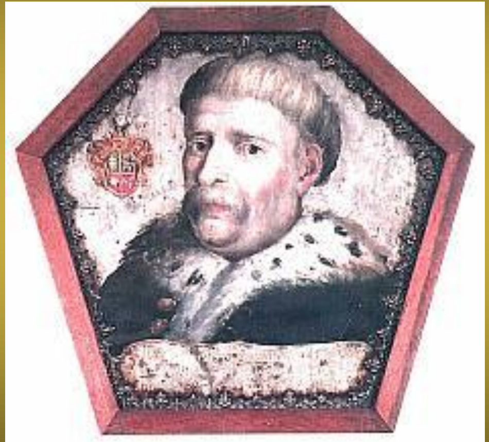
Stanisław Woysza ze Bzowa Podstoli Smoleński 1677